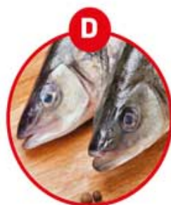
D FÜR FISCH UND DARAUS GEWONNENE ERZEUGNISSE (AUSSER FISCHGELATINE)

Eierteigwaren, panierte Speisen, Mayonnaise, Palatschinken, Kuchen, Gebäck, Brot, Nudeln, Croutons, Faschierter Braten, Burger, Feinkostsalate, Pasteten, Quiches, Soßen, Dressings, Desserts