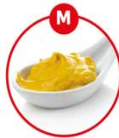
M FÜR SENF UND DARAUS GEWONNENE ERZEUGNISSE

Suppengrün, Gewürzbrot, Wurst, Fleischerzeugnisse, Fleischzubereitungen, Kräuterkäse, Fertiggerichte, Feinkostsalate, Brühe, Suppen, Eintopf, Marinaden, Gewürzmischungen, Curry, salzige Snacks (Chips)