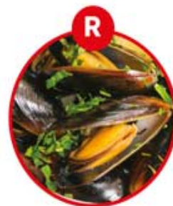
R FÜR WEICHTIERE WIE SCHNECKEN, MUSCHELN, TINTENFISCHE UND DARAUS GEWONNENE ERZEUGNISSE

Brot, Gebäck, Pizza, Nudeln, Snacks, fettreduzierte Fleischerzeugnisse, Fleischersatz/vegetarische Produkte, Desserts, milchfreier Eiersatz, Kaffeersatz, Flüssiggewürze