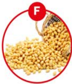
F FÜR SOJA (-BOHNEN) UND DARAUS GEWONNENE ERZEUGNISSE

Margarine, Brot, Kuchen, Gebäck, Schokocreme, Brotaufstriche, Cerealien, Müsli, Frühstücksflocken, Schokolade, Feinkostsalate, Marinaden, Satésauße, Eis, aromatisierter Kaffee, Likör, (Pommes Frites)