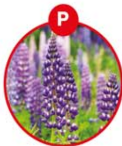
P FÜR LUPINEN UND DARAUS GEWONNENE ERZEUGNISSE

Fruchtzubereitung, Müsli, Brot, Fleischerzeugnisse und -zubereitungen, Feinkostsalate, Suppen, Soßen, Sauerkraut, Fruchtsaft, Chips und andere getrocknete Kartoffelerzeugnisse, gesalzener Trockenfisch