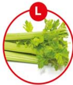
L FÜR SELLERIE UND DARAUS GEWONNENE ERZEUGNISSE

Brot, Kuchen, Gebäck, Brühwürste, (Pistazien), Rohwürste (Walnüsse), Pasteten, Feinkostsalate (Waldorf), Joghurt, Käse, Nuss-/Nougatcreme, vegetarische Aufstriche, Müsli, Schokolade, Marzipan, Müsliriegel, Kekse, Dressings, Curry, Pesto, Desserts, Likör, aromatisierter Kaffee