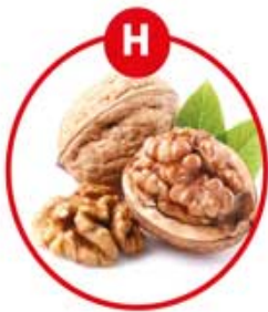
H FÜR SCHALENFRÜCHTE UND DARAUS GEWONNENE ERZEUGNISSE

Brot, Kuchen, Gebäck, Brüh-, Koch-, Roh-, Bratwurst, Feinkostsalate, Margarine, Nussnougatcreme, Müsli, Schokolade, Karamell, Aufläufe, Pommes Frites, Chips, Suppen, Soßen, Dressings, Marinaden, Desserts, Kakao, Wein