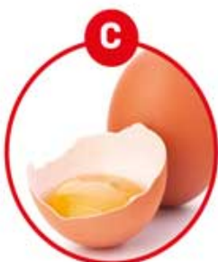
C FÜR EIER VON GEFLÜGEL UND DARAUS GEWONNENE ERZEUGNISSE

Feinkostsalate, Suppen, Soßen, Paella, Bouillabaisse, Sashimi, Surimi