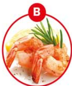
B FÜR KREBSTIERE- UND DARAUS GEWONNENE ERZEUGNISSE

Brot und Gebäck, Kuchen, Teigwaren, Suppen, Soßen, Paniermehl, Semmelbrösel, Wurstwaren, Backerbsen, Frischkornbreie, Desserts, Schokolade