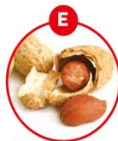
E FÜR ERDNÜSSE UND DARAUS GEWONNENE ERZEUGNISSE

Kräcker, Soßen, Suppen, Würzpasteten, Würste, Surimi, Sardellenwurst, Brotaufstriche, Feinkostsalate, Pasteten, Vitello tonnato