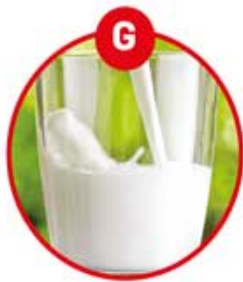
G FÜR MILCH VON SÄUGETIEREN UND MILCHERZEUGNISSE (INKLUSIVE LAKTOSE)

Brot, Kuchen, Gebäck, Feinkostsalate, Margarine, Schokocreme, Brotaufstriche, Müsli, Schokolade, Kekse, Kaugummi, Soßen, Dressings, Marinaden, Mayonnaise, Eis, Sportlernahrung, Diät drinks, Kaffeeweißer