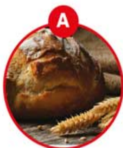
A FÜR GLUTENHALTIGES GETREIDE UND DARAUS GEWONNENE ERZEUGNISSE

Allergeninformation gemäß Codex-Empfehlung