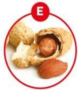
E FÜR ERDNÜSSE UND DARAUS GEWONNENE ERZEUGNISSE

Kräcker, Soßen, Suppen, Würzpasteten, Würste, Surimi, Sardellenwurst, Brotaufstriche, Feinkostsalate, Pasteten, Vitello tonnato