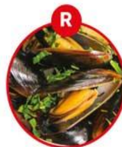
R FÜR WEICHTIERE WIE SCHNECKEN, MUSCHELN, TINTENFISCHE UND DARAUS GEWONNENE ERZEUGNISSE

Brot, Gebäck, Pizza, Nudeln, Snacks, fettreduzierte Fleischerzeugnisse, Fleischersatz/vegetarische Produkte, Desserts, milchfreier Eiersatz, Kaffeersatz, Flüssiggewürze