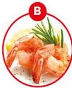
B FÜR KREBSTIERE- UND DARAUS GEWONNENE ERZEUGNISSE

Brot und Gebäck, Kuchen, Teigwaren, Suppen, Soßen, Paniermehl, Semmelbrösel, Würstwaren, Backerbsen, Frischkornbreie, Desserts, Schokolade