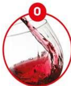
O FÜR SCHWEFELDIOXID UND SULFITE

Brot, Knäckebrot, Gebäck (süß und salzig), Müsli, vegetarische Gerichte, Falafel, Salate, Humus, Feinkostsalate, Marinaden, Desserts