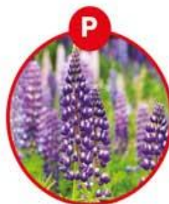
P FÜR LUPINEN UND DARAUS GEWONNENE ERZEUGNISSE

Fruchtzubereitung, Müsli, Brot, Fleischerzeugnisse und -zubereitungen, Feinkostsalate, Suppen, Soßen, Sauerkraut, Fruchtsaft, Chips und andere getrocknete Kartoffelerzeugnisse, gesalzener Trockenfisch