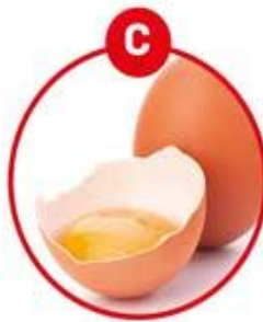
C FÜR EIER VON GEFLÜGEL UND DARAUS GEWONNENE ERZEUGNISSE

Feinkostsalate, Suppen, Soßen, Paella, Bouillabaisse, Sashimi, Surimi