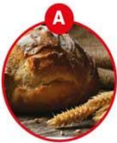
A FÜR GLUTENHALTIGES GETREIDE UND DARAUS GEWONNENE ERZEUGNISSE

Allergeninformation gemäß Codex-Empfehlung