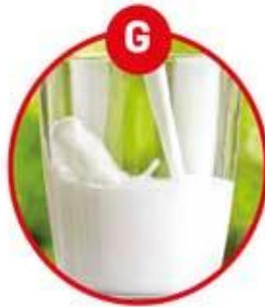
G FÜR MILCH VON SÄUGETIEREN UND MILCHERZEUGNISSE (INKLUSIVE LAKTOSE)

Brot, Kuchen, Gebäck, Feinkostsalate, Margarine, Schokocreme, Brotaufstriche, Müsli, Schokolade, Kekse, Kaugummi, Soßen, Dressings, Marinaden, Mayonnaise, Eis, Sportlernahrung, Diät drinks, Kaffeeweißer