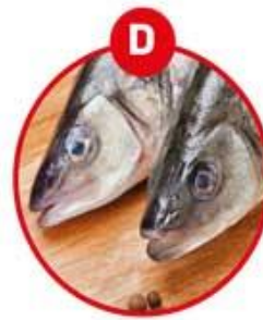
D FÜR FISCH UND DARAUS GEWONNENE ERZEUGNISSE (AUSSER FISCHGELATINE)

Eierteigwaren, panierte Speisen, Mayonnaise, Palatschinken, Kuchen, Gebäck, Brot, Nudeln, Croutons, Faschierter Braten, Burger, Feinkostsalate, Pasteten, Quiches, Soßen, Dressings, Desserts