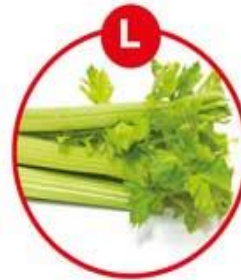
L FÜR SELLERIE UND DARAUS GEWONNENE ERZEUGNISSE

Brot, Kuchen, Gebäck, Brühwürste, (Pistazien), Rohwürste (Walnüsse), Pasteten, Feinkostsalate (Waldorf), Joghurt, Käse, Nuss-/Nougatcreme, vegetarische Aufstriche, Müsli, Schokolade, Marzipan, Müsliriegel, Kekse, Dressings, Curry, Pesto, Desserts, Likör, aromatisierter Kaffee