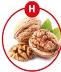
H FÜR SCHALENFRÜCHTE UND DARAUS GEWONNENE ERZEUGNISSE

Brot, Kuchen, Gebäck, Brüh-, Koch-, Roh-, Brätwurst, Feinkostsalate, Margarine, Nussnougatcreme, Müsli, Schokolade, Karamell, Aufläufe, Pommes Frites, Chips, Suppen, Soßen, Dressings, Marinaden, Desserts, Kakao, Wein