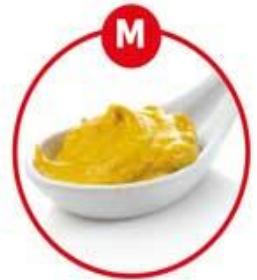
M FÜR SENF UND DARAUS GEWONNENE ERZEUGNISSE

Suppengrün, Gewürzbrot, Wurst, Fleischerzeugnisse, Fleischzubereitungen, Kräuterkäse, Fertiggerichte, Feinkostsalate, Brühe, Suppen, Eintopf, Marinaden, Gewürzmischungen, Curry, salzige Snacks (Chips)