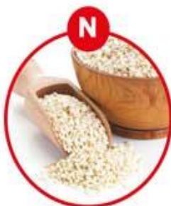
N FÜR SESAMSAMEN UND DARAUS GEWONNENE ERZEUGNISSE

Fleischerzeugnisse, Feinkostsalate, Suppen, Soßen, Dressings, Mayonnaise, Ketchup, eingelegtes Gemüse und Gewürzmischungen, Käse, Essigurken