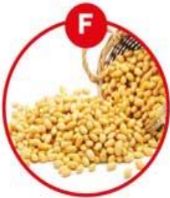
F FÜR SOJA (-BOHNEN) UND DARAUS GEWONNENE ERZEUGNISSE

Margarine, Brot, Kuchen, Gebäck, Schokocreme, Brotaufstriche, Cerealien, Müsli, Frühstücksflocken, Schokolade, Feinkostsalate, Marinaden, Satésauße, Eis, aromatisierter Kaffee, Likör, (Pommes Frites)